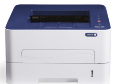
Phaser 3260. Εκτύπωση.