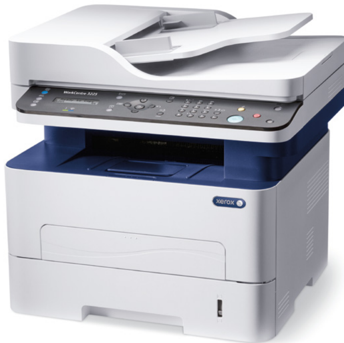
WorkCentre 3225. Αντιγραφή. Εκτύπωση. Σάρωση. Φαξ. Email.